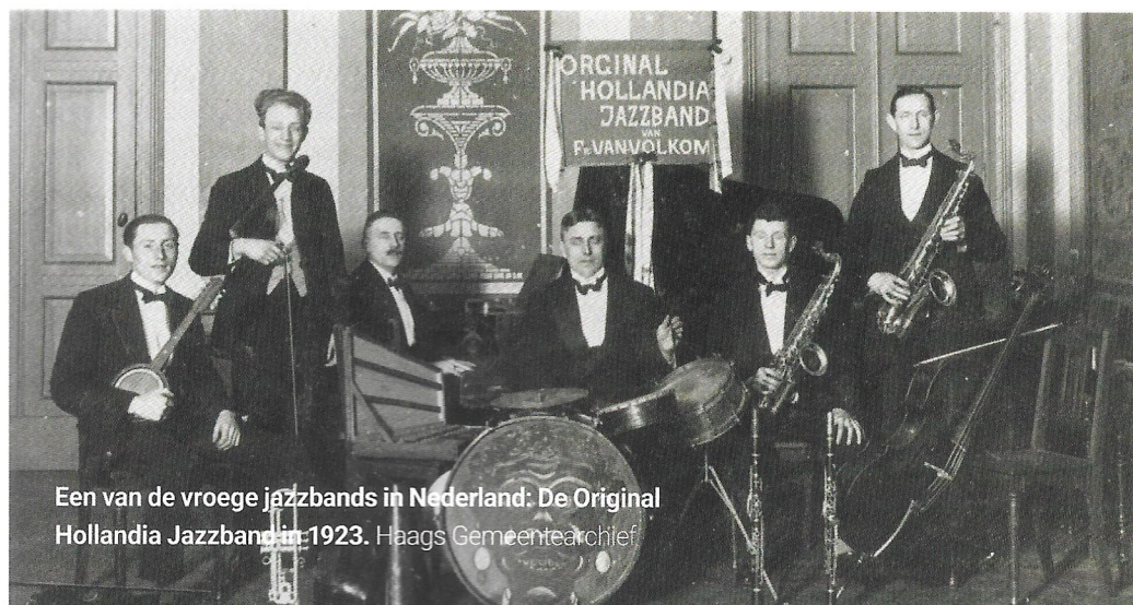
Een van de vroege jazzbands in Nederland: De Original Hollandia Jazzband in 1923.

rikaanse klarinettist Sidney Bechet. De Haagse gemeenteraad had al bedongen dat de rokjes van de danseressen met twee tot drie centimeter werden verlengd! Dat paste in het Haagse beleid en in de cultuuropvattingen van die tijd. Zo was dansmuziek toegestaan 'mits deze niet te veel geraas maakt en geen onwelluidende of hinderlijke klanken »