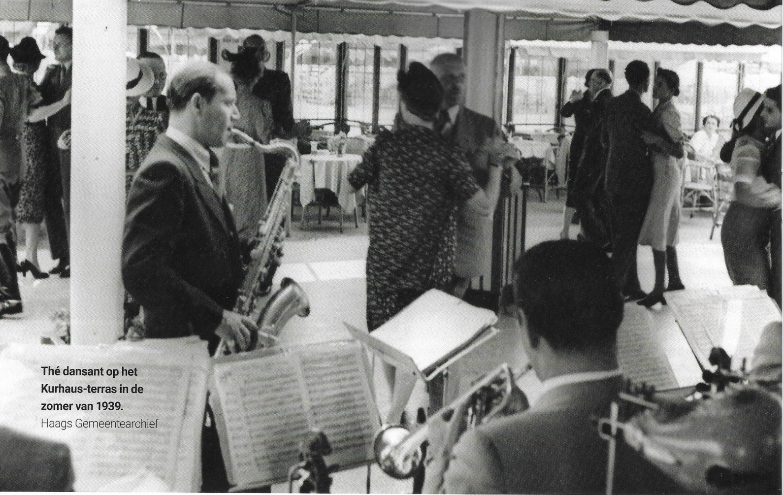
Thé dansant op het Kurhaus-terras in de zomer van 1939.